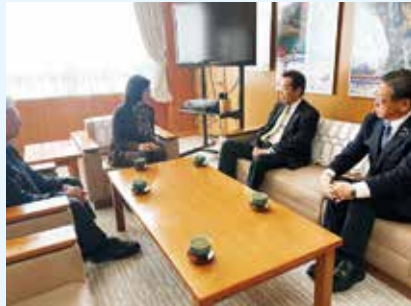
中原県副知事訪問