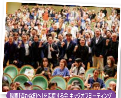
映画「遙かな町へ」を応援する会 キックオフミーティング