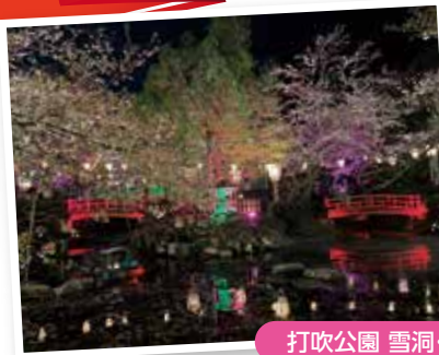
打吹公園 雪洞・ライトアップ点灯