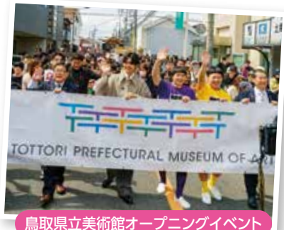
鳥取県立美術館オープニングイベント