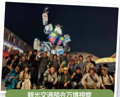
観光交通部会万博視察