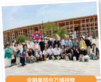
金融業部会万博視察