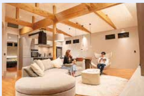
円護寺モデルハウス