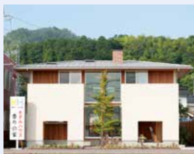
倉吉モデルハウス