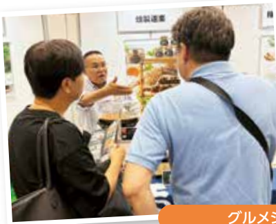
グルメショー出展