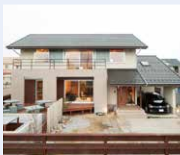
鳥取モデルハウス