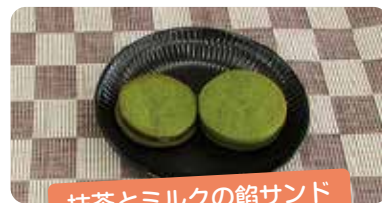
抹茶とミルクの餡サンド

鳥取県産のサーモンやトマト、ブロッコリーを使用。ブルーベリーソースを加え、彩りと味にアクセントをつけました。