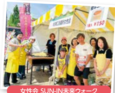
女性会 SUN-IN未来ウォーク