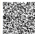
遥かな町へQR (会議所HP)