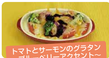
トマトとサーモンのグラタン 〜ブルーベリーアクセント〜

郷土料理「じゃぶ」を牛乳ベースでアレンジ。白みそを入れることで洋風になりすぎないように工夫しました。