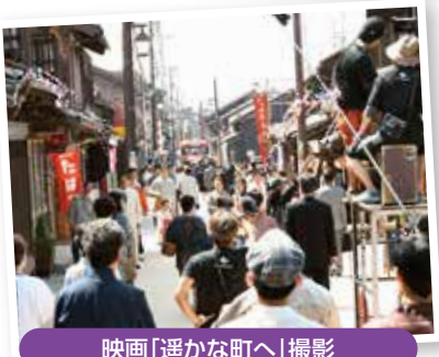
映画「遙かな町へ」撮影