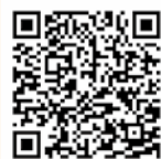
遥かな町へ クラウドファンディング