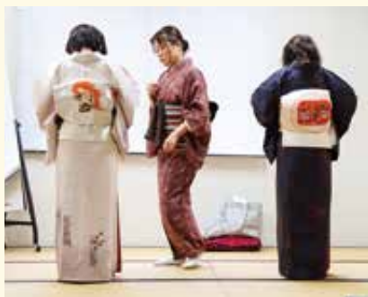
スイーツショップポストン/写真のカワラジョー 着物を着て和装でポージング