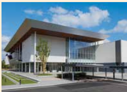
鳥取県立美術館が開館