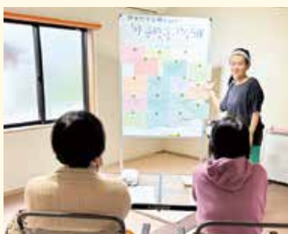
自力整体まるも ガチガチな体と心に「ゆるめるコツ」

この取り組みには、普段馴染みのない業種、店舗との交流を深めることが出来、お店の裏側などを知る良い機会となることから、幅広い年代の方々から多くの参加がありました。また、本来の事業内容とは異なる一風変わった取り組み内容のゼミ(事業者)もあり、新規顧客開拓、販路拡大の一助となっています。