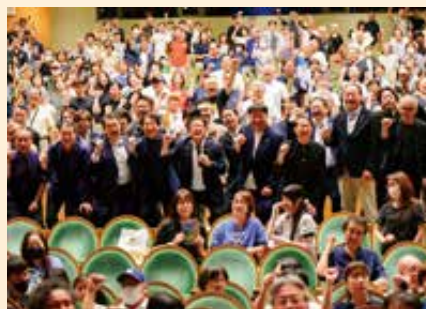
「映画『遥かな町へ』を応援する会」