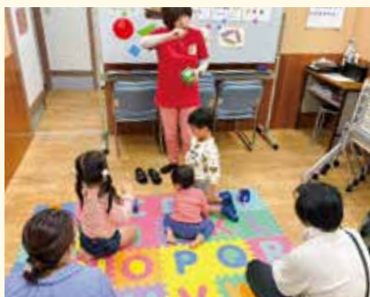
アーク学院 親子の初めて英会話