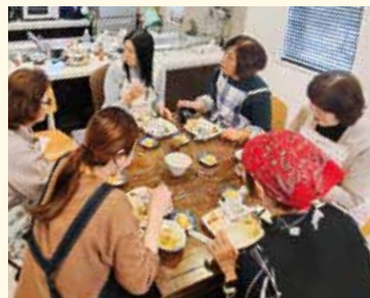
むかいぐみ 圧力鍋を使ってみよう