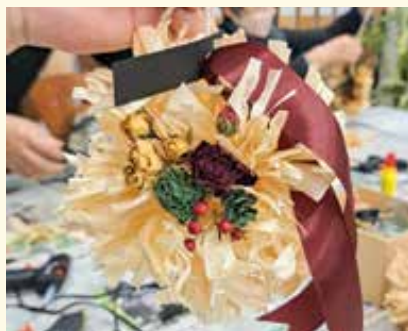
むかいぐみ かんなくずポンポン作り