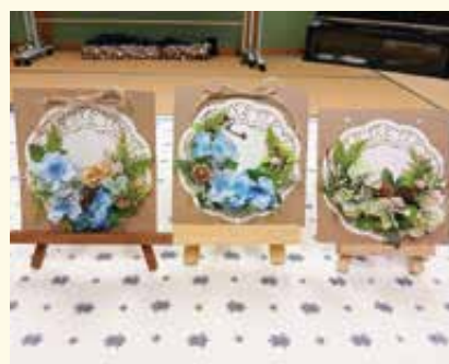
矢間モータース 小さなリース作り