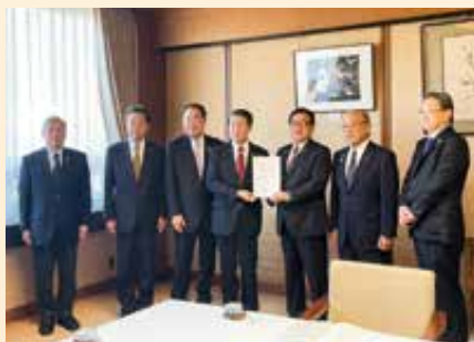
鳥取県知事への要望