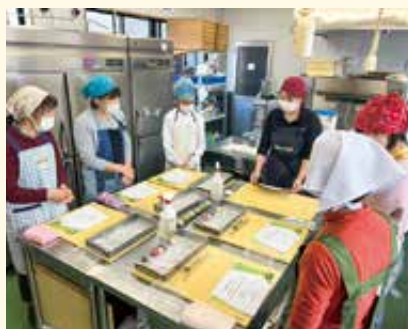
お菓子処まんばや 今日からあなたも和菓子職人