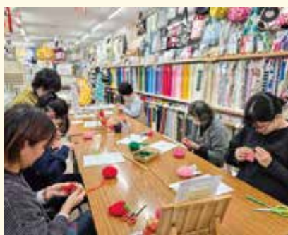
クラフトハートトーカイ倉吉店 かぎ針編みを体験してみましょう