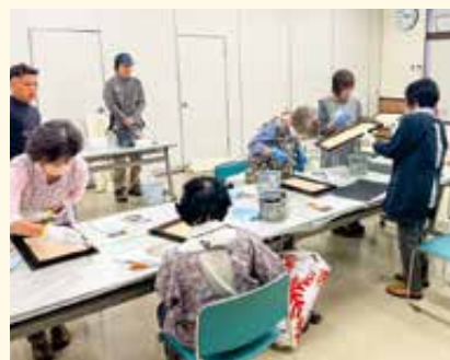
東洋インテリア 壁紙で作るおしゃれ長押 DIY