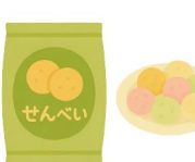
あられやせんべい など

例：外国人に向けたその地域ならではの食品、 地方空港・免税店などで買える“地域発”食品など