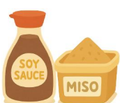
醤油・味噌・調味料