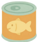
地元産品や料理の缶詰