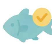
環境負荷を抑えた養殖魚 など

例：有機農産物、みえるらべる（生産者の環境負荷 低減の取組を星の数で表したラベル）取得農産物など